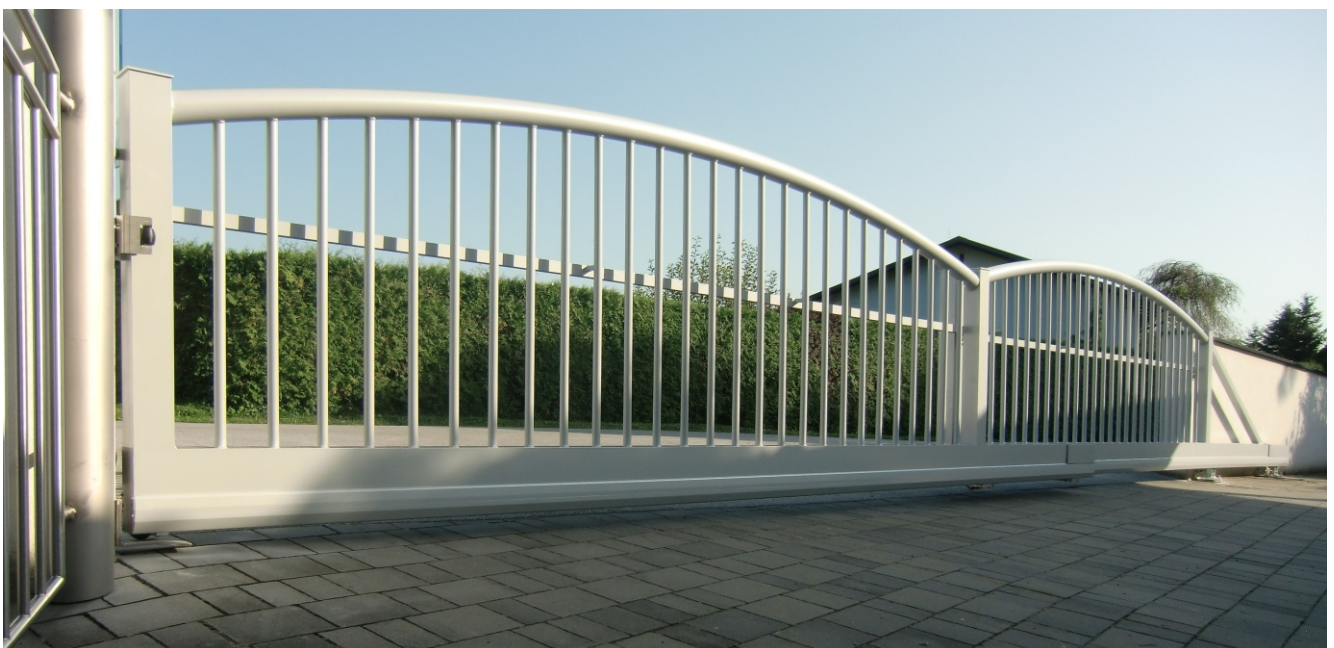
8,5m Teleskoptor mit oberer Torblattführung durch außenseitig montierte U-Profile